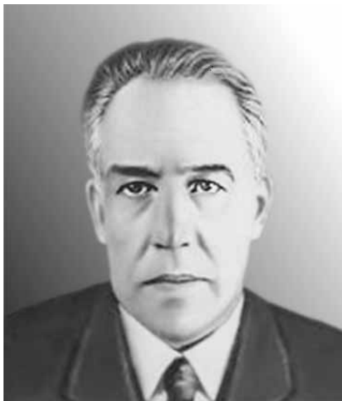
Нильс Хенрик Давид БОР

комбинаций в четко выраженные мысли, не спешить полностью осознать их. Ибо, не дав возможности развиваться случайным и нестандартным идеям, мы рискуем пресечь их свободный полет. Зафиксировать идею сразу же после ее появления – значит убить ее либо влить в старую форму. Не напрасно же говорят, что мысли умирают в тот момент, когда они воплощаются в слова. А поэт Ф. Тютчев выразил это в еще более парадоксальном заявлении: «Мысль изреченная есть ложь»!