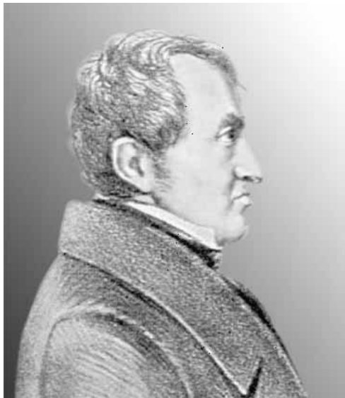
Андре Мари АМПЕР

уловить который тем ниже, чем менее подготовлен к этому исследователь.