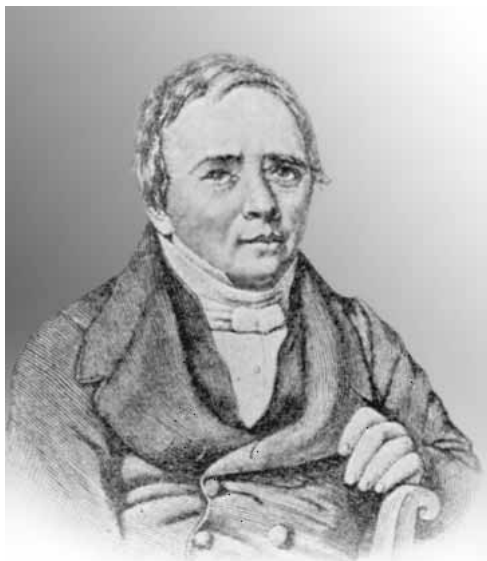
Ганс Христиан ЭРСТЕД

сломал черенок лопаты и скрепил обломки спицами, которые соединил дугами для скелетного вытяжения. Черенок держался прочно, как будто и не был сломан.