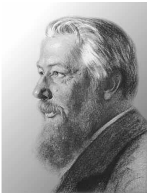
Вильгельм Фридрих ОСТВАЛЬД

Немало фактов творчества во сне собрано о художниках, композиторах, поэтах, писателях. Это образ знаменитой мадонны Рафаэля и ряд созданий Ф. Гойи, мелодия Первого концерта для фортепьяно с оркестром П. Чайковского и мотив «Дьявольской» сонаты Д. Тартини, это план и несколько сцен 1-го акта «Горя от ума» А. Грибоедова и т.д.